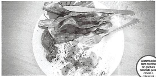
Alimentação com excesso de gordura saturada pode elevar o colesterol

O emagrecimento saudável está em uma alimentação equilibrada, diz o médico. "Racionalismo e os exageros historicamente não trouxeram bons resultados. Não há vida sem colesterol. Precisamos respeitar as proporções recomendadas para a nossa dieta, priorizando as gorduras insaturadas e ricas em ômega 3", finaliza.